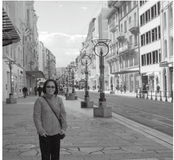
美麗的城市一日內瓦，每一個角落都讓我想拍下來

離開自己工作多年的舒適圈，參加這個世界級的國際大會，讓自己體驗一下不同的文化刺激，激盪自己的腦力，從不